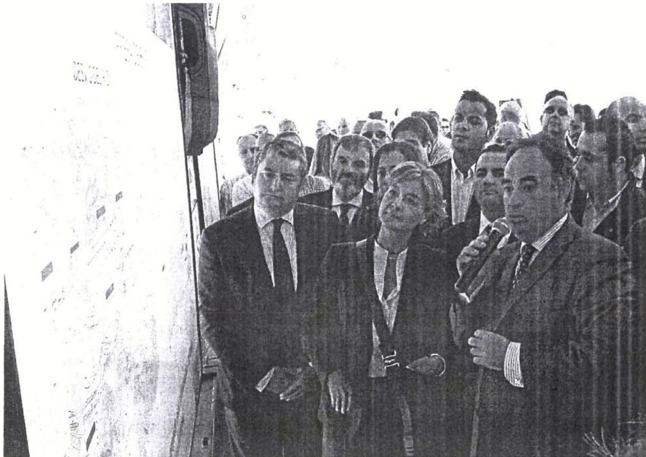
La ministra, rodeada de autoridades, durante la explicación de la obra realizada previa al acto de inauguración.